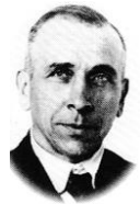
Alfred Wegener 1880-1930

Tout le monde l'attend, il ne peut plus faire marche arrière...